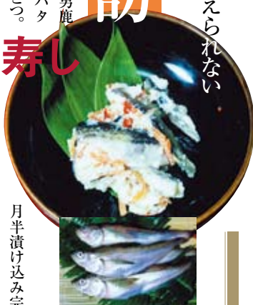
商品についての問い合わせは 男鹿海洋物産(有) ●0185-23-3393

月半漬け込み完成。いわゆる「飯すし」の一種だ。適度の大きさに切られたものはわさび醤油で、一匹丸ごと漬けられたものはさらに軽く焼いてから食べても美味い。かつては各家々ごとにごく普通に作られていたが、最近では専門業者の作るものが主流。中でも、「男鹿海洋物産(有)の「鱒寿し」は、ハタハタの産地としても知られる男鹿半島に伝わる技法を踏襲。地元産の素材にこだわり、甘さも控えめ。ハタハタ本来の味を楽しむことで地元でも評判の逸品だ。